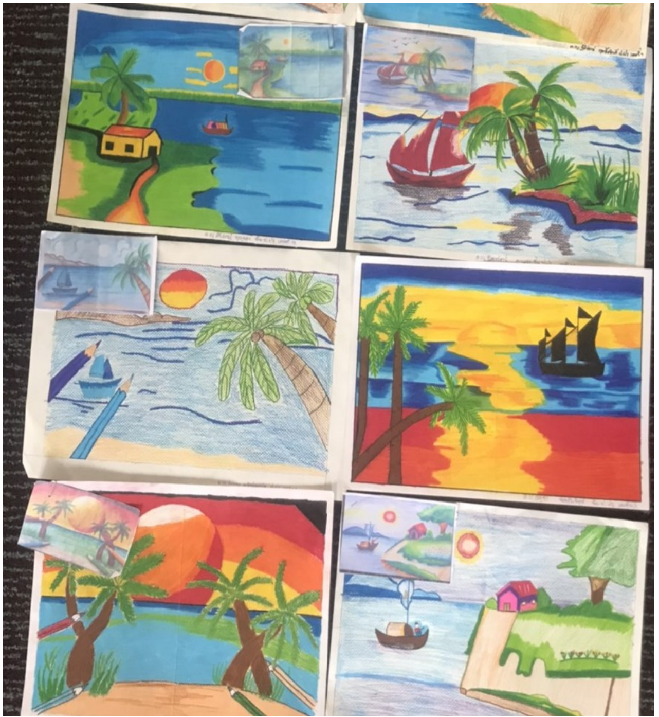
เอกสารงานวิจัยในชั้นเรียน : กลุ่มสาระการเรียนรู้ศิลปะ โรงเรียนวัดโพธิ์ฟ้า สังกัดสำนักงานเขตพื้นที่การศึกษาระดับประถมศึกษาปทุมธานี เขต ๑